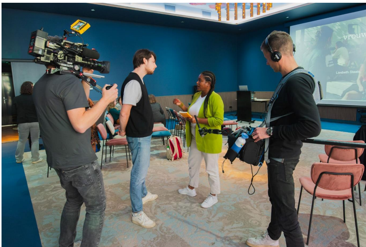
Interview VVAO-lid met EO-televisieploeg.